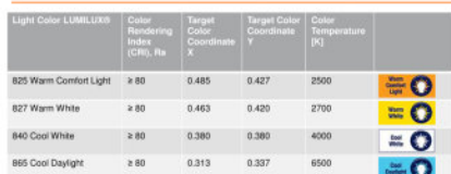
Light colors, color rendering properties and Light Color Coordinates for OSRAM DULUX® - lamps with integrated control gear

Datenname | DRG CODE | Initial Technikname | TTM LUMILUX