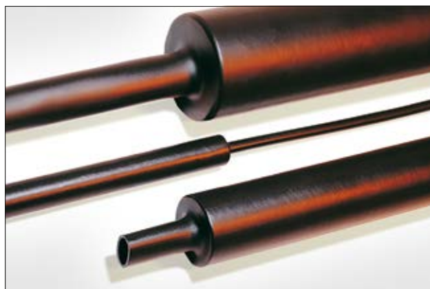
Gaine à paroi moyenne MU47 sans adhésif

Disponible également en manchons sur demande. Contactez-nous !