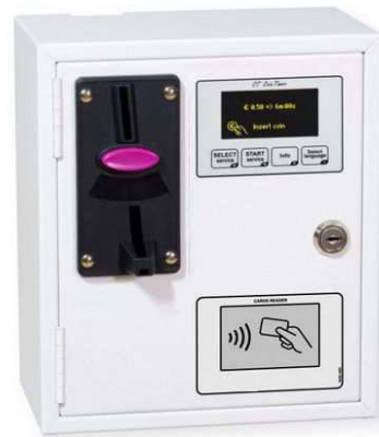
Avec introducteur multi-pièces