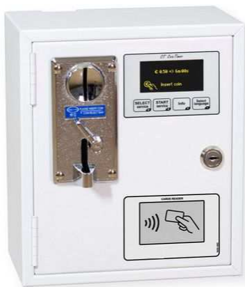
Avec introducteur mono-pièce

Minuteur avec lecteur RFID pour cartes prépayées et introducteur de pièces/jetons. Pour commande de 4, 6 ou 8 douches. Bloc alimentation à entrée 230Vca et sortie 12Vcc fourni. Sortie(s) 12Vcc pour commande directe d'électrovanne. Écran OLED intégré.