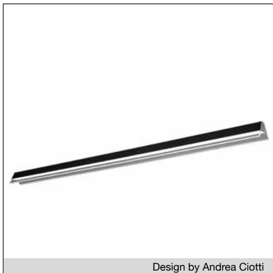
Design by Andrea Ciotti