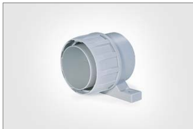
Raccords FG-UH avec support.