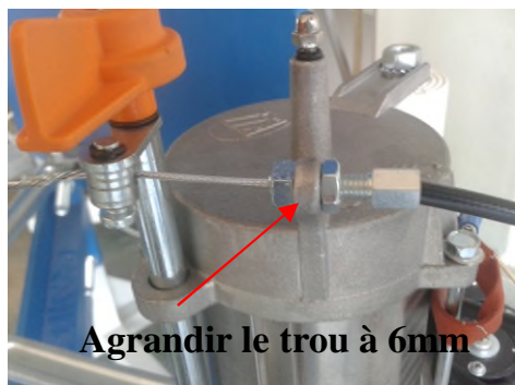
Agrandir le trou à 6mm