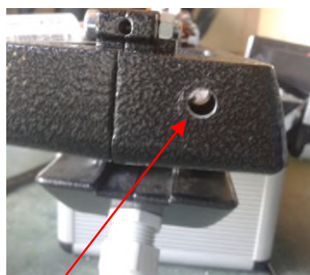
Percer un trou de 6mm