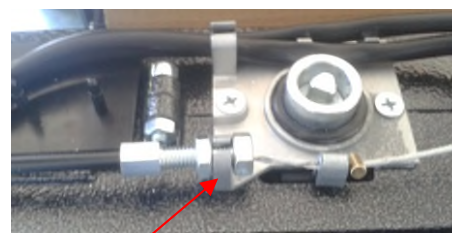
Agrandir le trou à 6mm