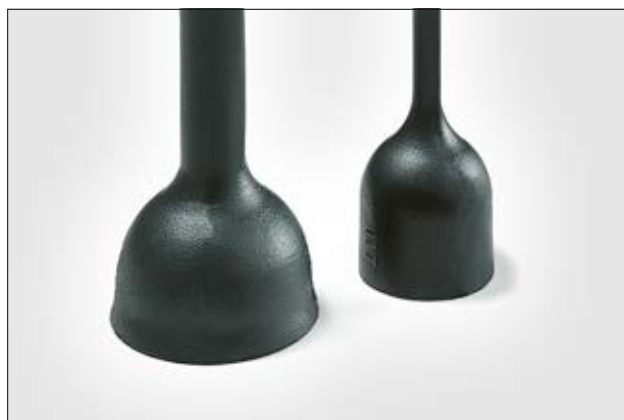
177-1-G, avant et après rétreint.