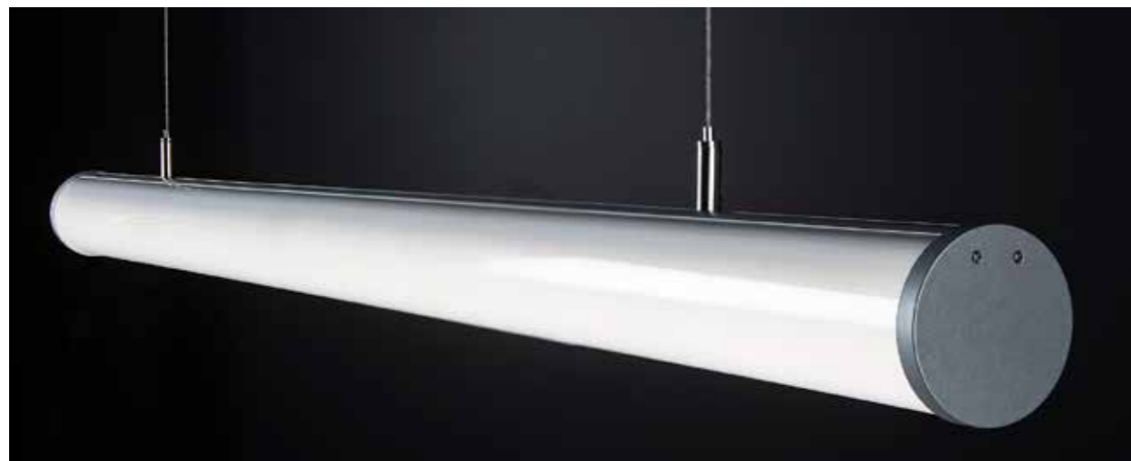
Angle avec diffuseur opale

• J+3 J+7 voir conditions, prix et délais pages 20-21.