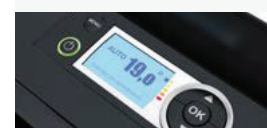
MODÈLE GRIS ARDOISE