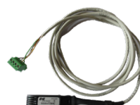
Sonde T° / humidité filaire