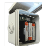
Sonde T° HF piles