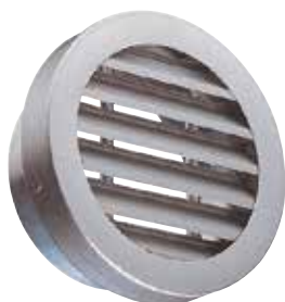
AR637 FO D200

La grille extérieure circulaire murale AR 637 permet la prise d'air ou le rejet d'air vicié sans risque d'entrée de pluie grâce à la forme des ailettes.