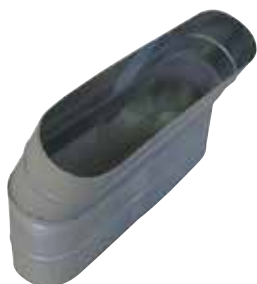
Coude Vertical Oblong 30°

Le coude vertical oblong 30° permet de changer la direction d'un réseau oblong de 30°.