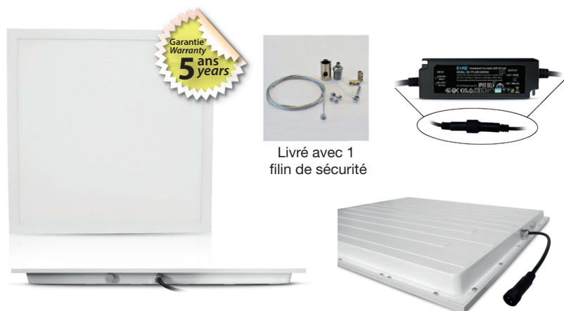
Livré avec 1 filin de sécurité

Ne pas débrancher l'alimentation côté luminaire quand l'alimentation est sous tension.