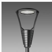
3355 Garda 5 - rotosymétrique