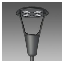
3360 Iseo 1 - rotosymétrique