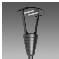
3350 Garda 1 - rotosymétrique