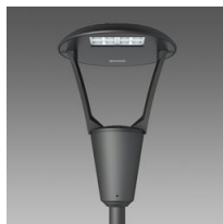
3361 Iseo 2 - public routier