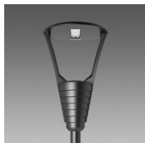
3351 Garda 2 - asymétrique