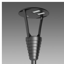
3352 Garda 3 - piste cyclable