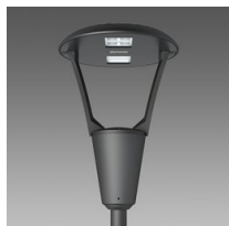
3362 Iseo 3 - caténaire