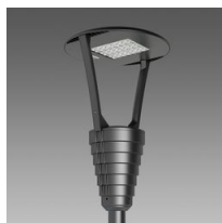
3350 Garda 1 HE - rotosymétrique