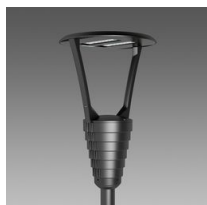
3353 Garda 4 - piste cyclable + public routier