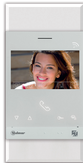
Montage en rénovation sur la plaque de propreté G MAC/ART