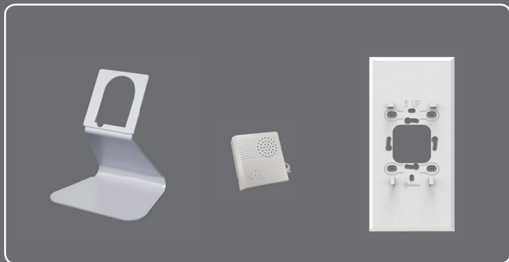
Support de table G SOB/UNI

Attribution de sonneries différenciées suivant provenance de l'appel (portes, palier, intercommunication ...)