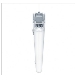
Réglette à LED pour chemin lumineux TECTON B BASIC LED5200-840 L1522 LDE WH 42182821