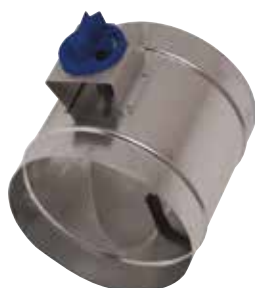
Registre d'Equilibrage en aluminium

Le registre d'équilibrage alu permet de régler la pression dans des branches de réseaux aérauliques en aluminium en bâtiment tertiaire ou collectif.