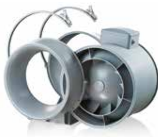
Bloc moteur démontable