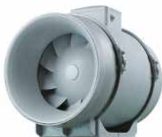
IN LINE XPro

IN LINE XPro est un ventilateur de conduit performant et économe en énergie. Son bloc moteur démontable facilite le montage et la maintenance.