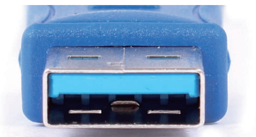
Connecteur type A mâle