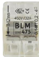
Marquage de la longueur de dénudage