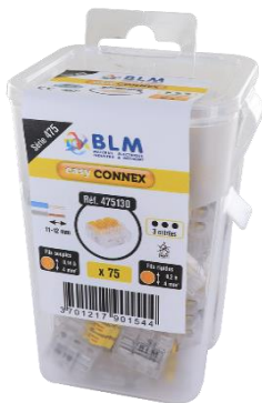
Pot avec trou européen rabattable et clip pour ceinture