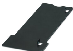
Plaque d'adaptation pour feuilles US

https://www.phoenixcontact.com/fr/produits/1044355