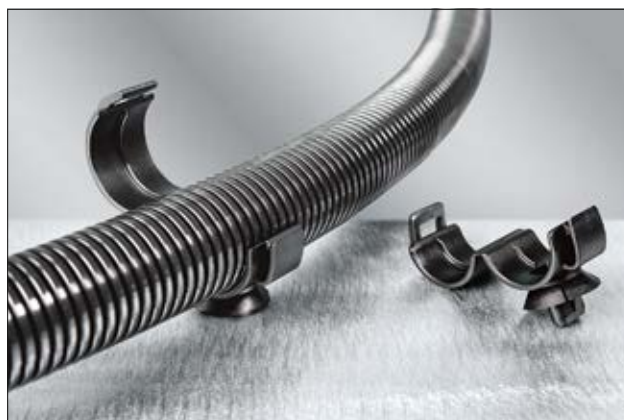
Clip pour gaines et tubes annelés, en application.