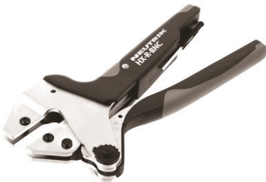
Pince à sertir Neutrik : HXR BNC