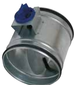
Registre d'Equilibrage Perforé en aluminium

Le registre d'équilibrage alu permet de régler la pression dans des branches de réseaux aérauliques en aluminium en bâtiment tertiaire ou collectif.