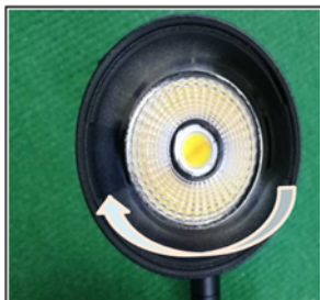
Figure2 Remove the front cover