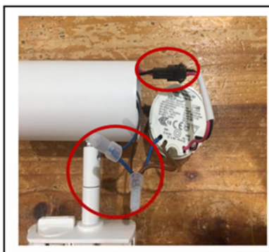
Figure2 Loose the connection