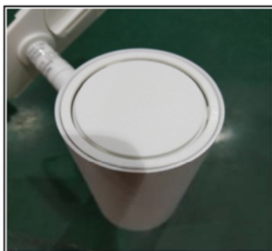
Figure1 Remove the top cover