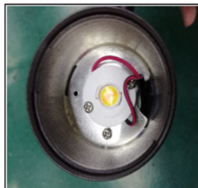
Figure3 Remove the reflector