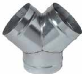
Culotte Simple 90°

La culotte simple 90° permet d'assurer la confluence de 2 branches de réseau galvanisé à 90° l'une de l'autre.