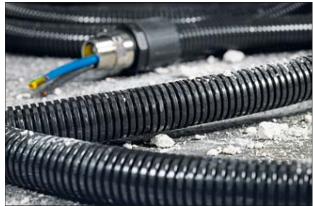
HelaGuard HG-SW, pour applications industrielles.