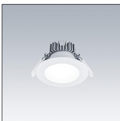
Downlight LED CETUS3 S 1500-840 HF RWH 96634887

La présente déclaration de produit environnemental (EPD) est basée selon les normes EN ISO 14025 et EN 15804 et décrit les impacts spécifiques environnementaux du produit mentionné. Cette déclaration fait suite également aux exigences spécifiques et concrètes du programme Institut Bauen und Umwelt e.V. (IBU) selon les règles de calcul des LCA et le contenu de l'EPD (de base) selon les instructions de PCR sous-jacentes (PCR: Règles de catégorie de produit) pour «Luminaires, lampes et composants pour luminaires» (Ref: IBU PCR Teil A et B). Le produit décrit sert d'unité déclarée. La déclaration inclut une description du produit, des informations sur la composition des matériaux, la production, le transport, la phase d'utilisation, l'élimination et le recyclage, ainsi que les résultats de l'évaluation du cycle de vie. Les EPD des produits de construction sont comparables uniquement si les valeurs sont calculées conformément au même PCR et des scénarios d'utilisation appropriés et obligatoires.