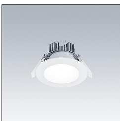
Downlight LED CETUS3 S 1500-840 HF RWH 96634887