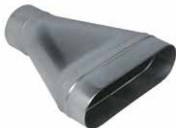
Réduction Concentrique Oblongue Cylindrique

La RCOC permet de raccorder un réseau oblong à un réseau circulaire.