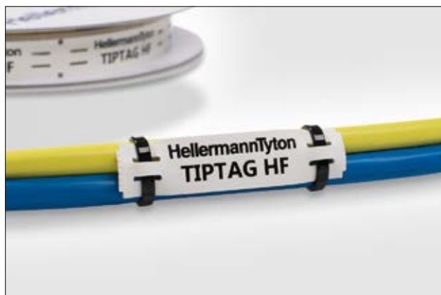
TIPTAG - pour une identification haute performance des faisceaux et harnais.