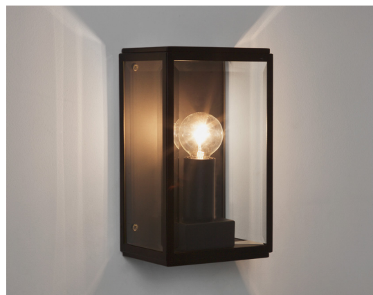
CODE: 1095040 FINISH: TEXTURED BLACK

THIS PRODUCT IS NOT SUITABLE FOR INSTALLATION WITHIN FIVE MILES OF THE COAST. FOR THESE ENVIRONMENTS, PLEASE FILTER PRODUCTS ON THE ASTRO WEBSITE BY 'COASTAL'.