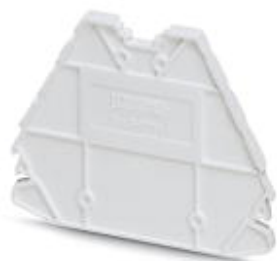
Flasque d'extrémité, Longueur: 63,6 mm, Largeur: 3,8 mm, Hauteur: 48,9 mm, Coloris: blanc

Remarque : les données indiquées ici sont tirées du catalogue en ligne. Vous trouverez toutes les informations et données dans la documentation utilisateur. Les conditions générales d'utilisation pour les téléchargements sur Internet sont applicables. ( http://phoenixcontact.fr/download )