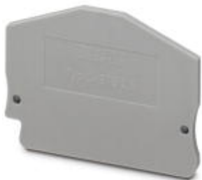
Flasque d'extrémité, Longueur: 51 mm, Largeur: 2,2 mm, Hauteur: 43 mm, Coloris: gris

Remarque : les données indiquées ici sont tirées du catalogue en ligne. Vous trouverez toutes les informations et données dans la documentation utilisateur. Les conditions générales d'utilisation pour les téléchargements sur Internet sont applicables. ( http://phoenixcontact.fr/download )