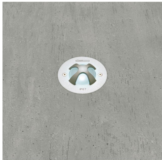
1638 Starled LED - A croce