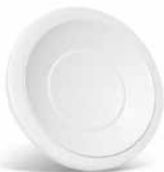
SR 145 D200

La bouche à noyau SR 145 en acier au débit réglable sur site assure le soufflage d'air.