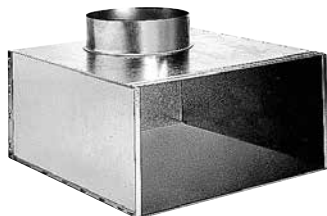
Plénum ME F3