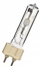
144030 TUN CMH-T G12 70W 830 U PLUS