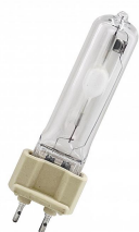
145922 CM-T G12 70W 942