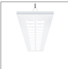
Luminaire suspendu à LED MIRL DI LED5800-830 EVG WH ASQ1 42183047