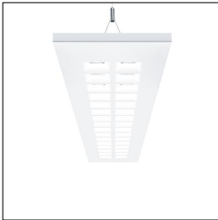
Luminaire suspendu à LED MIRL DI LED5800-830 EVG WH ASQ1 42183047