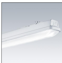
Luminaire étanche LED AQFPRO S LED4300-840 PC MB HFI 96630794