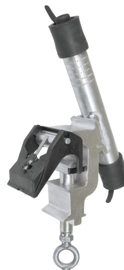
CD74 AG06-148 GS