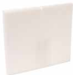
Mousse acoustique D100 mm