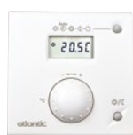
T55 réf. 073 951