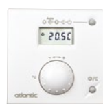
T58 (radio) réf. 075 313