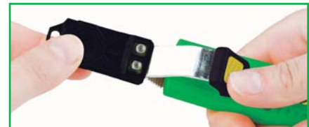
Capuchon de sécurité clipsable