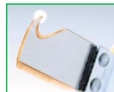
Lame traitée au nitrure de titane