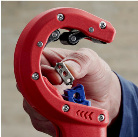
!Wenn die Klinge abgenutzt ist, kann sie ohne Werkzeug gewendet oder ausgetauscht werden!