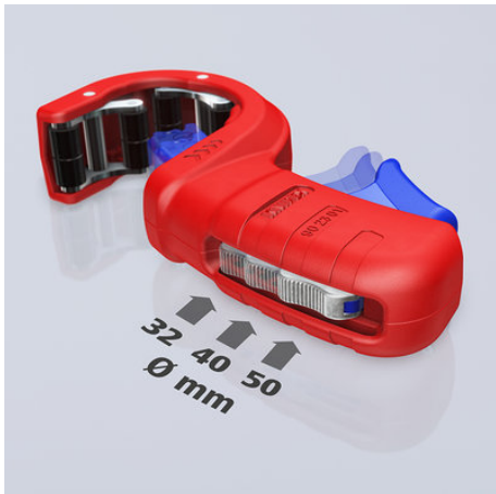
!Drei Durchmesser mit einem Werkzeug: Der Rohrdurchmesser lässt sich mit dem Metallversteller vor einstellen!