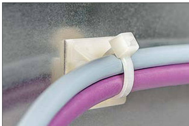
Embases de la série TY, en application.