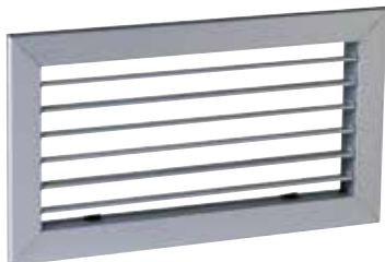
AC 101 F3 400X200

La grille murale AC 101 en aluminium permet la reprise d'air dans un local pour des installations de ventilation ou de conditionnement d'air.