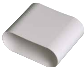
Raccord mâle 40x100 mm