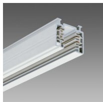
Omnitrack 3 allumages