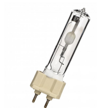
HMC150830T/01 MASTERC CDM-T 150W/830 G12