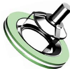
Série SLI (sanitaire)