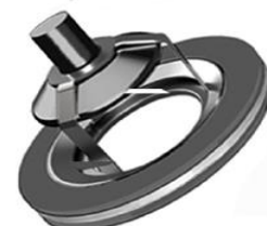
Série SL (chauffage)